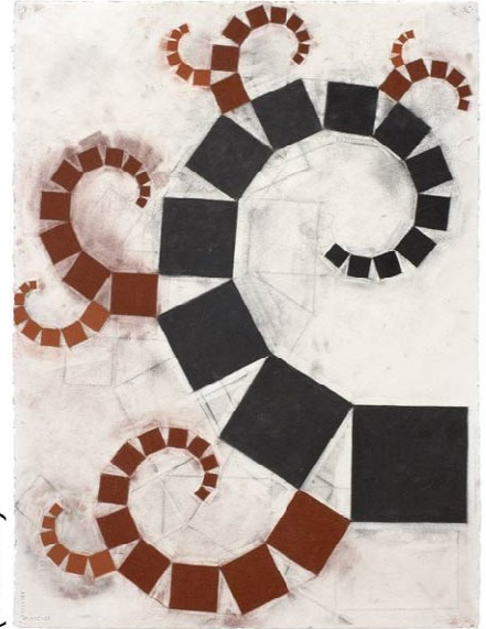
Pitágoras (2) (2006)