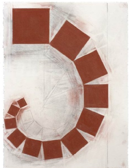
Pitágoras (4) (2006)