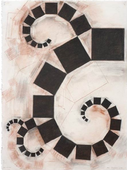
Pitágoras (1) (2006)