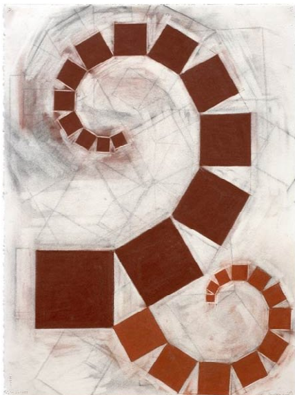
Pitágoras (3) (2006)