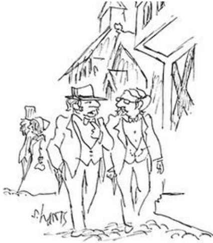
El problema con Moebius es que piensa que solo hay una cara para cada cuestión